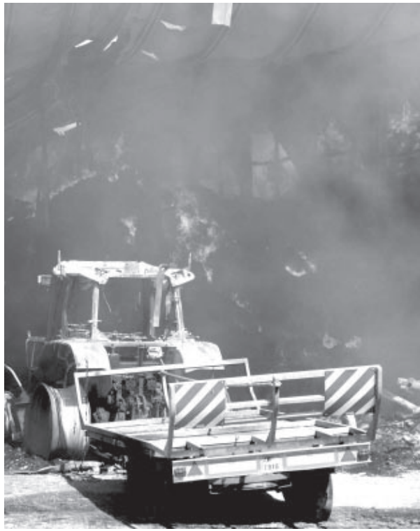
L'incendio scoppiato nella masseria

“ I vigili del fuoco hanno impiegato molte ore per domare il rogo divampato ieri sera ”